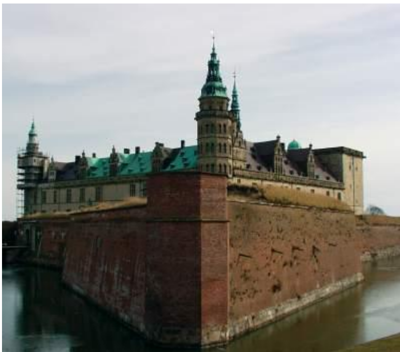
Kronborg Slot under en restaurering i vor tid - læs mere på www.kronborg.dk

Fra gammel tid havde kongen haft ret til "konningekøb" på sildemarkedet en bestemt ugedag, d.v.s. at købe alle de sild, han ville til en billig penge og det var forbudt for alle andre at handle før kongen. Frederik II fordrede 60 læster á 12 tdr. saltet sild til sine orlogsskibe ( har prøvet at finde oplysninger, der kunne hjælpe med nutidens mål for 1 læst; men umiddelbart er det ikke beskrevet klart - men måske er der nogle, der ligger inde med viden om denne ældre betegnelse...?? ) Nogle år efter blev det til 80 læster og desuden betingede han sig i 1580 eneret på indkøb af sild fra mandag aften til onsdag aften. det var i de år, hvor han byggede Kronborg, som stod færdig i 1584.