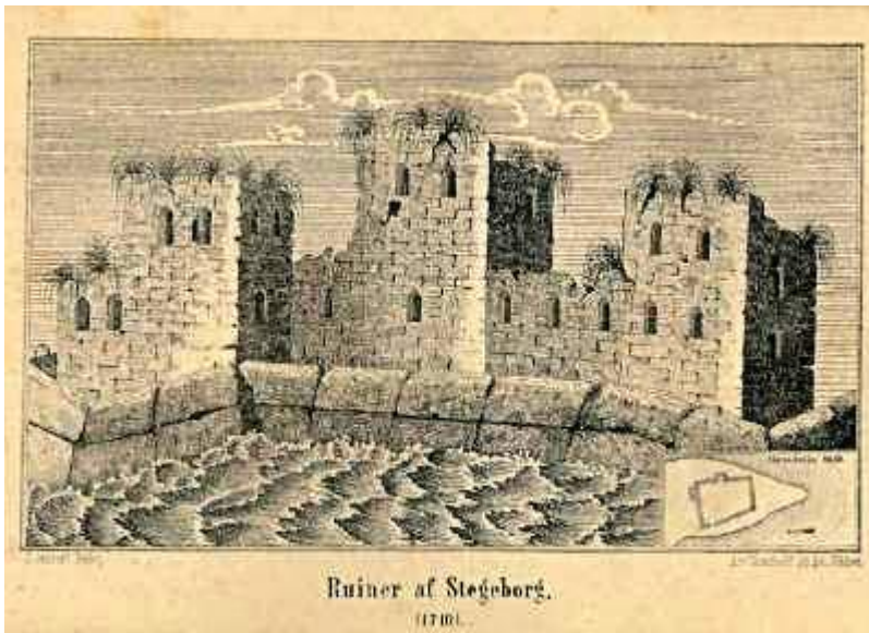
Ruinen af Stegehuus dateret 1710...